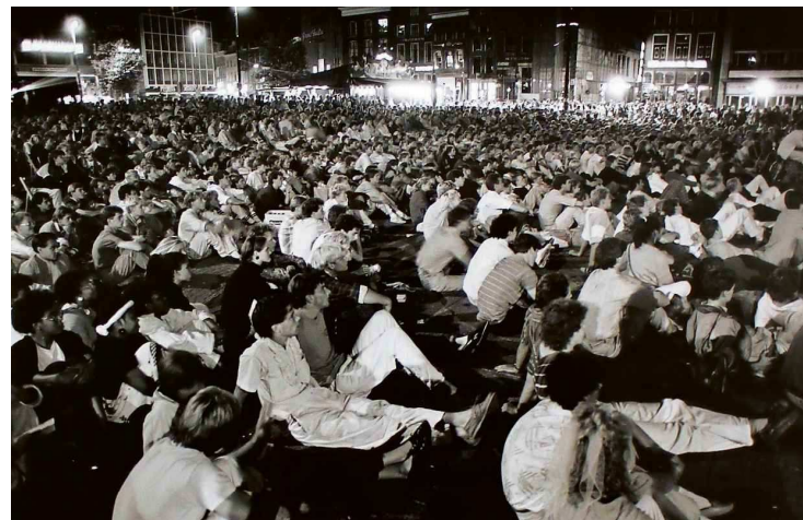
In 1986 keken de studenten de film Beverly Hills Cop op de Grote Markt in Groningen.