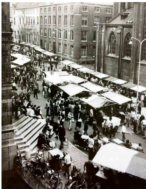
De informatiemarkt op het Broerplein in 1979. Hier leren de studenten alles over de verschillende studentenverenigingen in de stad.

Groei aantal deelnemers KEI-week Jaar - Deelnemers 1969 - 1600 1990 - 2156 2006 - 2816 2017 - 5028 2018 - ?