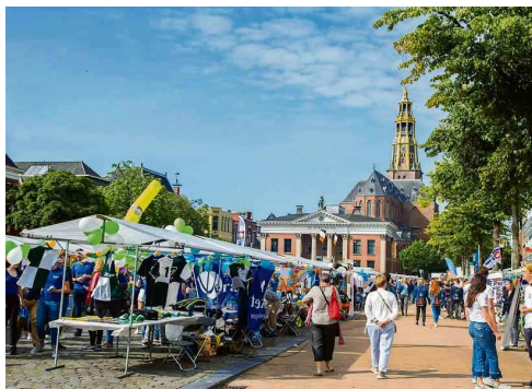
De informatiemarkt in 2017. In de verschillende standjes laten studentenverenigingen zien waar ze voor staan.

Zo ontstond de wens voor een algemene kennismakingsperiode. De nieuwe stroom studenten moest wegwijs worden gemaakt in de noordelijke studentenstad. En dus werd de KEI-week uit de grond gestampt. Een primeur. Groningen was de eerste stad met zo'n introductieweek waarin voorlichting en feesten centraal staat. Eerst georganiseerd vanuit de universiteit. Drie jaar later werd de Stichting KEI opge-